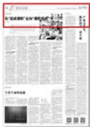
《光明日报》 发表十余篇 专家解读文章