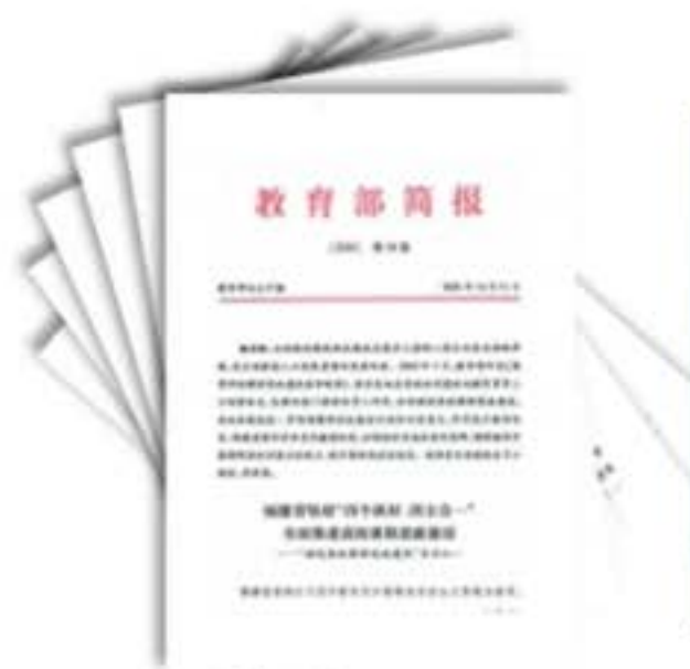
编发六期 《教育部简报》