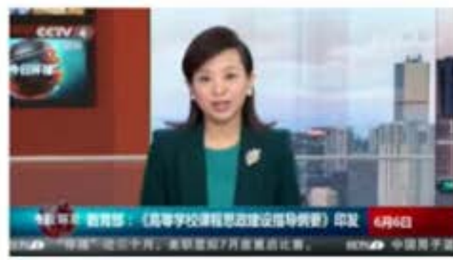
中央电视台 《今日环球》