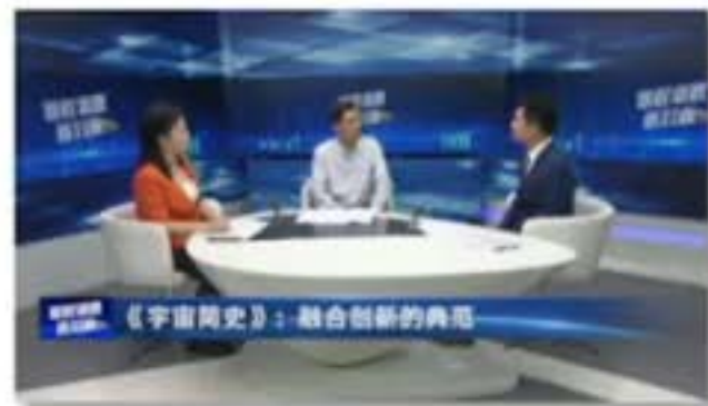
中国教育电视台 《课程思政面对面》