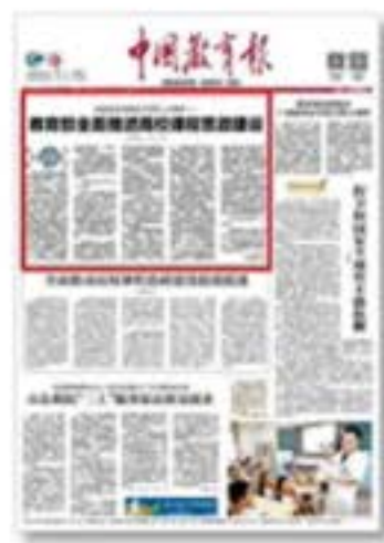
《中国教育报》 头版头条报道 课程思政工作