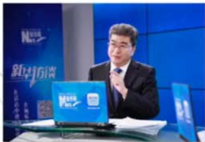
新华网专访 介绍课程思政